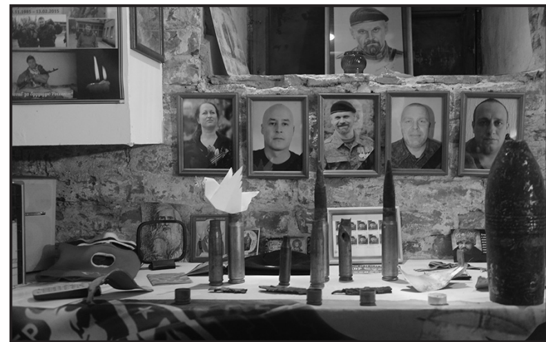
приехал отец-ополченец. Людей, даже детей, из квартир выгоняют на мороз».

Другое дело националистические батальоны, наёмники, «солдаты удачи» из ЧВК — нет их страшнее. В батальоне «Азов» есть масса наёмников — россияне-националисты, шведы, норвежцы, много поляков. Даже негры есть. Есть и натовские инструкторы и военспецы — руководят военными операциями. Нацисты из территориальных батальонов и запрещённого в нашей стране Правого сектора никого не щадят, расстреливают пленных, уверены, что Донбасс — это «москалии», нелюди, «москаляку на гиляку». Опыные своей полной беззаказностью, среди нацистов полно маньяков, психически неполноценных, просто разного рода криминальных типов. Грабят мирных жителей, которых призваны «защищать». Заходят в дома, забирают еду, одежду, всё, что можно унести. В разговор вступил ополченец постарше: «В Иловаяшке прибили к забору убитого ребенка, а мать таскали за бэтэжками, требовали, чтобы