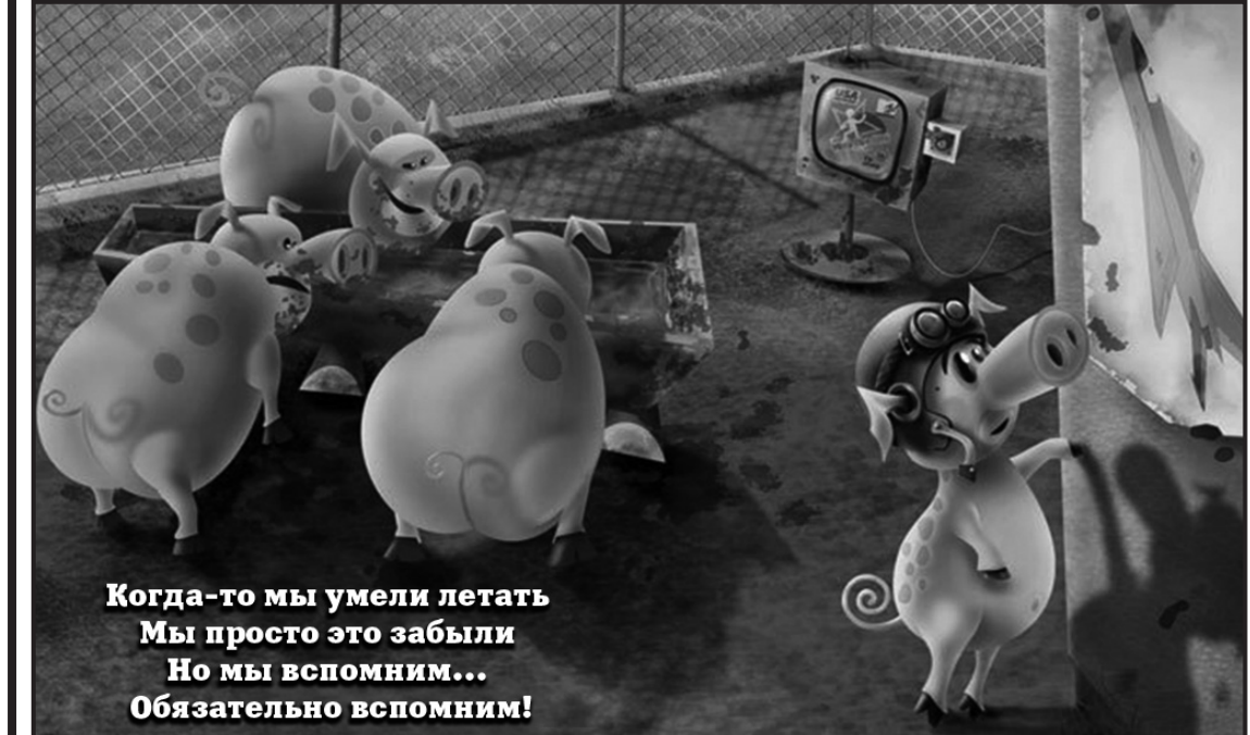
Когда-то мы умели летать. Мы просто это забыли. Но мы вспомним... Обязательно вспомним!

Уже давно - с мая 2015-го - лежит у меня снятая с сайта Каспарова статья неизвестного мне Игоря Яковенко «Мы всё равно часть европейской цивилизации. О качестве населения и либеральной оппозиции». Сохранил я эту статью исключительно из-за приведенных в ней неизвестных мне американских данных о советских людях Сталинской эпохи. Яковенко сообщает об источнике их происхождения: «Такую возможность даёт Гарвардский проект, видимо, самый масштабный проект исследования советского человека сталинских времён». Эти данные, действительно, с совершенно неожиданной стороны показывают, насколько гуманным (созданным именно для людей) был Советский Союз Сталина и насколько люди, даже изменившие Родине, это видели и понимали: